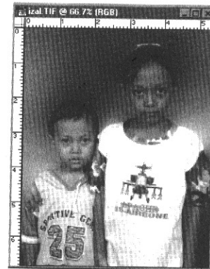
Gambar 1.7.3. Hasil akhir setelah terisolasi.