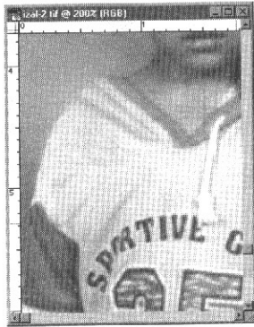
Gambar 1.7.4. Bagian yang tidak diinginkan sudah terbang.