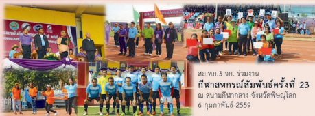
สอ.ทก.3 จก. ร่วมงาน กีฬาสหกรณ์สัมพันธ์ครั้งที่ 23 ณ สนามกีฬากลาง จังหวัดพิษณุโลก 6 กุมภาพันธ์ 2559

สอ.ทก.3 จก. จัดโครงการพัฒนานุคลากร ประจำปี 2559 หลักสูตร “ฝ่ายจัดการ VS การพัฒนาสหกรณ์”