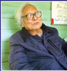
NLD မှာလည်း သာကူးတွေရှိတယ် သူခိုးတွေလည်း ရှိမှာပေါ့

“NLD ထဲမှာစုတ်ပြတ်သတ်နေတာလည်းရှိတယ်။ အချောင်သမားတွေ ဝင်လာတယ်။ ကြံဖွဲ့ထဲကလည်းဝင်လာတယ်။ ဘယ်လောက်ပဲရှိ ရှိပါ။ သူတို့လိုအပိုင်စီးပြီးတော့ဒီရွာကကြံဖွဲ့ရွာတို့၊ ကြံဖွဲ့လမ်းတို့ဆိုတာမျိုး ပြောတာ မရှိဘူး...။ ၁၁