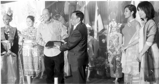
မကျင်းပခြင်းမခံပေ။

ATF ကို ၁၉၈၀ ခုနှစ်မှစတင်၍ နှစ်ပတ်လည်အရင်းအမြစ်ကျင်းပခဲ့ ရာ ယခု ၂၀၁၄ ခုနှစ်မှာ (၃၇)ကြိမ်မြောက် ဖြစ်သည်။ ၁၉၈၂ ခုနှစ် တစ်စိတ်တည်း သာလျှင် အခြေအနေအရပ်ရပ်ကြောင့်